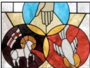
Drie-enige God Vader-Zoon-Geest

https://www.youtube.com/watch?v=dRX84n3uAuU